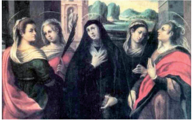
Santa Fosca e Santa Maura

Ciò che nel mio fratello per qualsiasi motivo – o per necessità o per infermità del corpo o per leggerezza di costumi – vedo non potersi correggere, perché non lo sopporto con pazienza? Perché non lo curo amorevolmente, come sta scritto: I loro piccoli saranno portati in braccio ed accarezzati sulle ginocchia? (cfr. Is 66, 12). Forse perché mi manca quella carità che tutto soffre, che è paziente nel sopportare e benigna nell'amare secondo la legge di Cristo! Egli con la sua passione si è addossato i nostri mali e con la sua compassione si è caricato dei nostri dolori (cfr. Is 53, 4), amando coloro che ha portato e portando coloro che ha amato. Invece colui che attacca ostilmente il fratello in necessità, o che insidia alla sua debolezza, di qualunque genere sia,