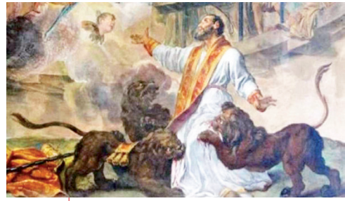
Sant'Ignazio di Antiochia

Se io in poco tempo ho contratto con il vostro vescovo una così intima fa-