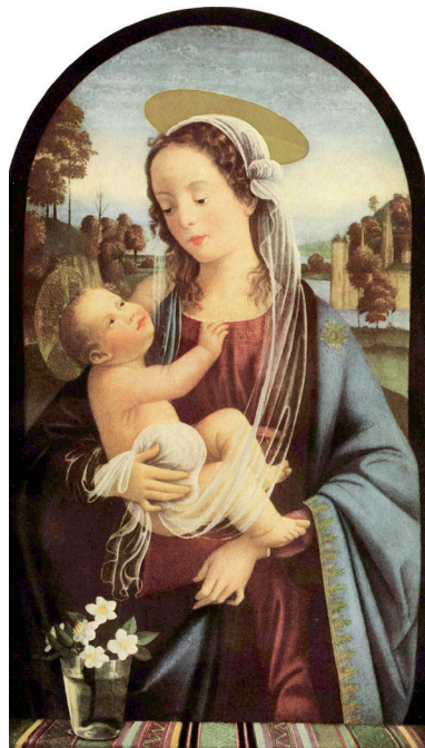
MARIA SS. MADRE DI DIO

Benché il Verbo abbia preso un corpo mortale da Maria, la Trinità è rimasta in se stessa qual era, senza sorta di aggiunte o sottrazioni. E' rimasta assoluta perfezione: Trinità e unica divinità. E così nella Chiesa si proclama un solo Dio nel Padre e nel Verbo.